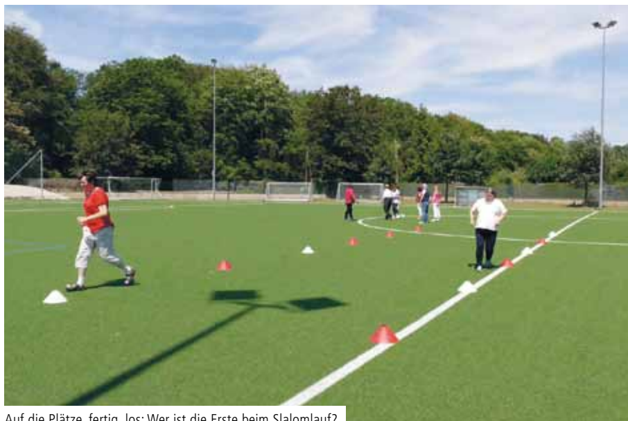
Auf die Plätze, fertig, los: Wer ist die Erste beim Slalomlauf?

„Im sportlichen Miteinander können unsere Klienten Ängste überwinden