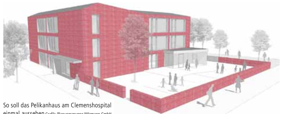
So soll das Pelikanhaus am Clemenshospital einmal aussehen Grafik: Planungsgruppe Wörmann GmbH

Das Pelikanhaus soll über insgesamt zwölf Zimmer mit jeweils mehreren Schlafmöglichkeiten und eigenem Bad verfügen. Bei der Planung legen wir besonders großen Wert auf die Gestaltung der Gemeinschaftsräume. Die große Wohnküche schafft eine familiäre Atmosphäre und soll zum Austausch mit anderen betroffenen Fami-