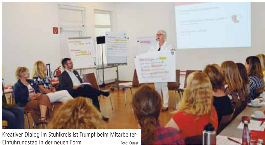
Kreativer Dialog im Stuhlkreis ist Trumpf beim Mitarbeiter-Einführungstag in der neuen Form

Der Einführungstag für neue Mitarbeiter in neuem Format