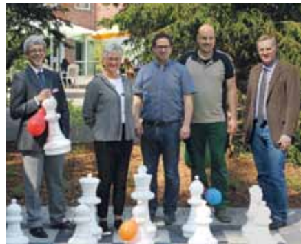
Passend zum Welt-MS-Tag wurde das neue begehbare Schachspielfeld im Park des Augustahospitals fertig

In der Eingangshalle nutzten viele Betroffene und Angehörige die Gele-