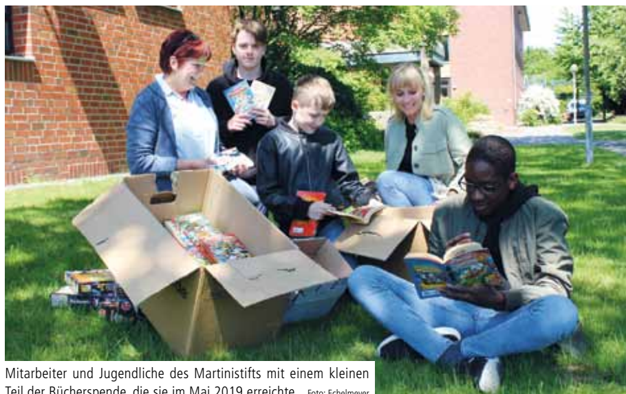
Mitarbeiter und Jugendliche des Martinistifts mit einem kleinen Teil der Bücherspende, die sie im Mai 2019 erreichte

Hunderte Lustige Taschenbücher als Spende für das Martinistift