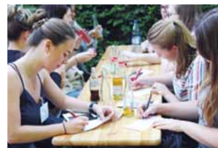
Gruppenarbeit im Freien bei sommerlichen Temperaturen

Natürlich wurde dem Nachwuchs auch Gehör geschenkt: „Unsere Auszubildenden sind die Pflegeexperten von morgen. Ihre Wünsche an die Pflege, den Beruf und vor allem an uns Alexianer nehmen wir auf und gestalten