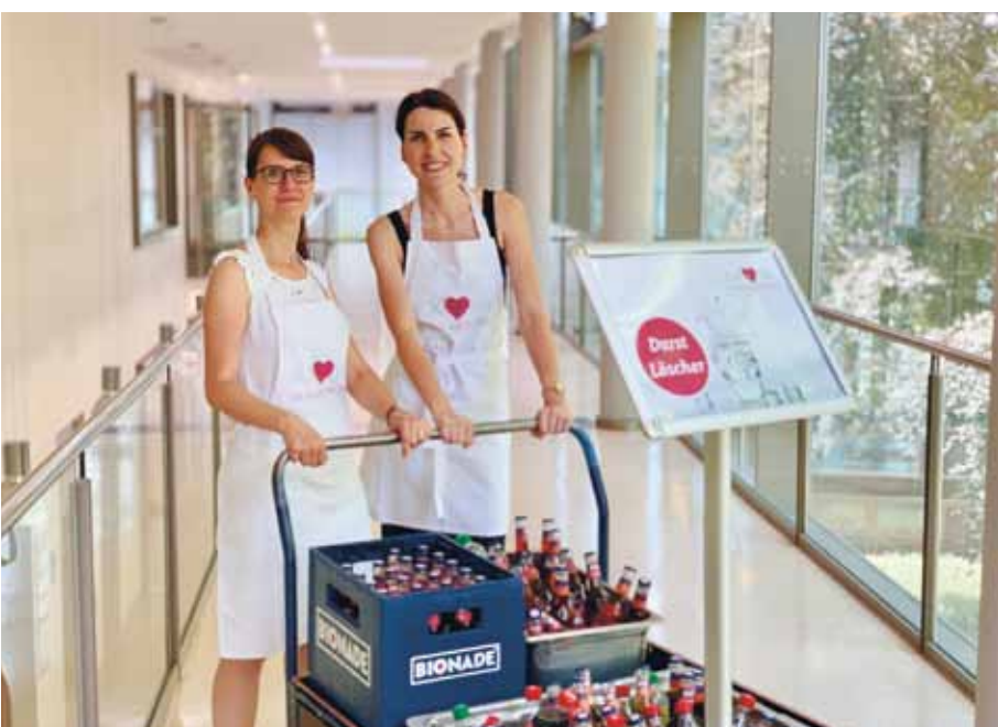
Ebenfalls eine Tradition: die Durstlöscheraktion mit kühlen Getränken ...