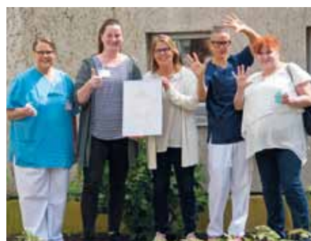
Das Hygieneteam der Raphaelsklinik freut sich über den Erfolg auf dem Gebiet der Krankenhaushygiene

Nur 17 von mehr als 200 teilnehmenden Kliniken in NRW erreichten 2019 diese Auszeichnung.