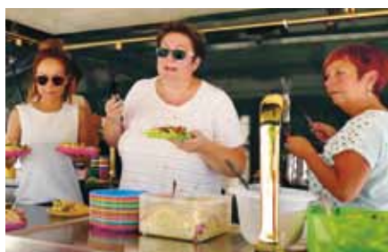
Mit leckeren selbstgemachten Salaten versorgten die PSZ-Mitarbeiterinnen die Sportler