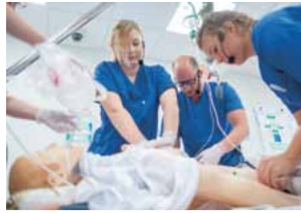
Für den Ernstfall üben am Patient „Simulationspuppe“ im neuen ALX-Simulationszentrum

Als „Patienten“ dienen Simulationspuppen, an denen man die Symptomatik, zum Beispiel eines Herzinfarktes, elektronisch umfassend darstellen kann. Herzfrequenz, Durchblutung, Sauerstoffsättigung des Blutes oder auch die Pupillengröße werden wie auf einer „richtigen“ Intensivstation aufgezeichnet. Mit Infusionen und Medikamenten kann in eine akute Situation eingegriffen werden.