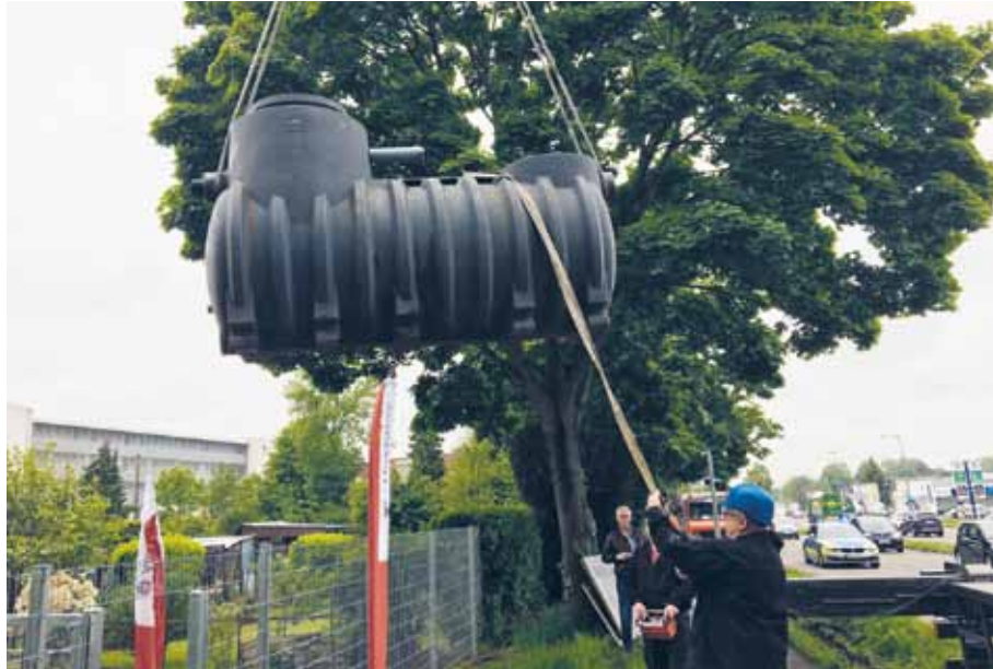
Die Sanitherm Peter Schumacher GmbH stiftete und installierte im Alexianer-Kleingarten einen Wassertank

Anja Schröder, eine Teilnehmerin der Angebote in der Tagesstätte, in akribischer Kleinarbeit ein Modell des Kleingartens gebaut. Die Fotogruppe der Externen Tagesstruktur LT24 ge-