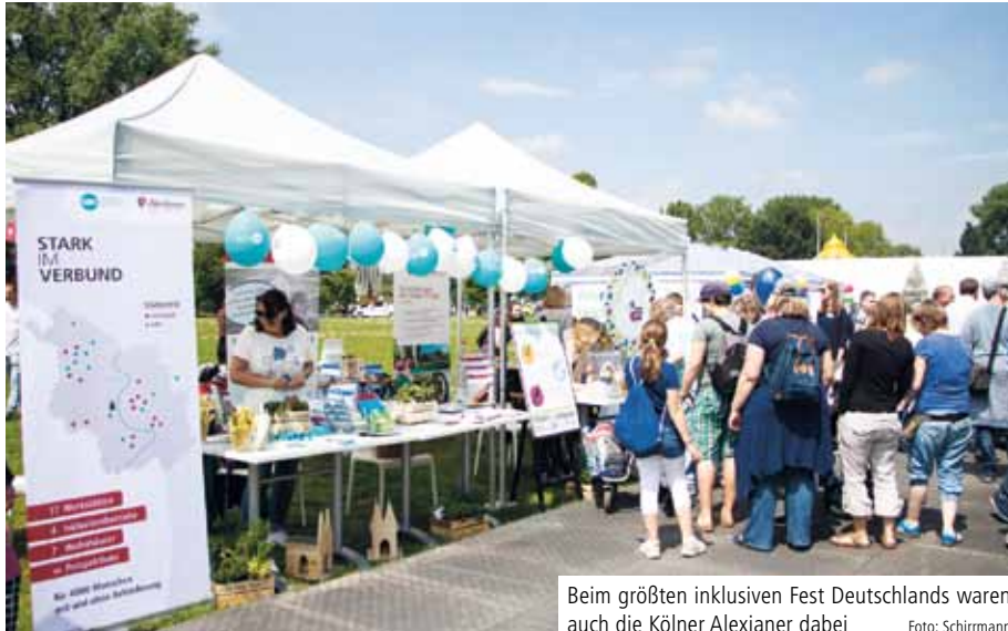
Beim größten inklusiven Fest Deutschlands waren auch die Kölner Alexianer dabei

KÖLN. Zum bundesweit größten inklusiven Familienfest, dem Tag der Begegnung, waren in diesem Jahr in Köln erneut die Alexianer Werkstätten GmbH zusammen mit der Gemeinnützige Werkstätten GmbH und der Alexianer Köln GmbH mit einem Informationsstand zu Angeboten der Eingliederungshilfe vertreten.