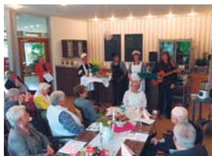
„Küchenlieder“ gab es beim Wolbecker Mittagstisch zu hören

Der Wolbecker Mittagstisch, ein Begegnungsangebot im Achatius-Haus feierte eine Dekade, ebenso der „zeitraum.“, ein Tagesstrukturangebot in Hilstrup. Beide Angebote werden gut genutzt und luden zahlreiche Gäste zu ihren Jubelfesten ein. ✗ (ce)