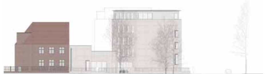
Visualisierung Fassadenansicht des Neubaus an der Gartenstraße in Berlin-Weißensee Foto/Visualisierung: M.R Architekten

flügel inklusive einem Ateliergebäude entstehen. Die Gebäude umschließen einen begrünten Hof mit zahlreichen Sitzbänken. Die Bewohnerinnen und Bewohner wohnen in Einzelzimmern mit eigenem Bad. Das Ateliergebäude kann für Therapien genutzt werden. Die Bauherrenvertretung übernimmt die Alexianer Agamus GmbH. ✕ (ap)