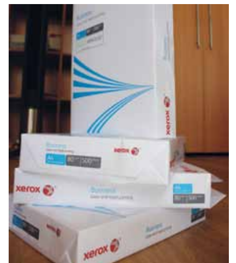
Papierberge werden monatlich für die Lohnabrechnung verbraucht. Eine Alternative ist die digitale Lohnabrechnung