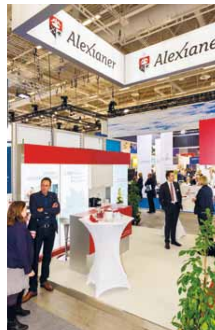
An drei Tagen wurde informiert, diskutiert und gefachsimpelt. Auch am Stand der Alexianer

Zu der Leitveranstaltung von Gesundheitspolitik und Gesundheitswirtschaft kamen rund 8.500 Teilnehmerinnen und Teilnehmer in den Berliner CityCube. In diesem Jahr lautete das Kongressmotto „Gesundheitspolitik, Gesundheitsversorgung, Gesundheitsberufe in Zeiten des digitalen Wandels“. Eröffnet wurde der Kongress durch Gesundheitsminister Jens Spahn. Unübersehbar waren, wie in den Jahren zuvor, auch die Alexianer vertreten – mittendrin und schon von Weitem gut sichtbar mit ihrem hell erleuchteten Stand. ✕ (tk)