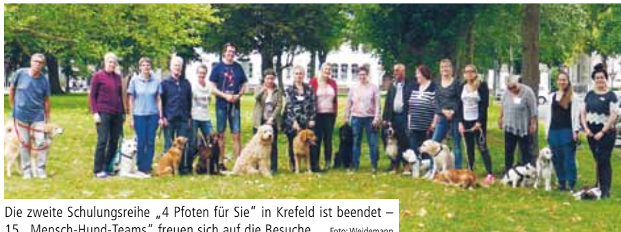
Die zweite Schulungsreihe „4 Pfoten für Sie“ in Krefeld ist beendet – 15 „Mensch-Hund-Teams“ freuen sich auf die Besuche

Die neuen, vom Hundetrainer und dem Team des Gerontopsychiatrischen