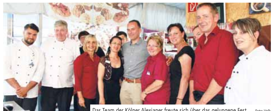
Das Team der Kölner Alexianer freute sich über das gelungene Fest

ckeren Art und den soulig vorgetragenen Coversongs für gute Laune. In der Programmpause genossen die Gäste die sommerlichen Köstlichkeiten vom Freiluftbuffet. So galt am Ende der Applaus nicht nur den beiden Künstlern, sondern auch der Cateringcrew aus Mitarbeitern des Hotels Begardenhof, der Krankenhausküche und dem Team des Klostercafés. ✕ (kv)