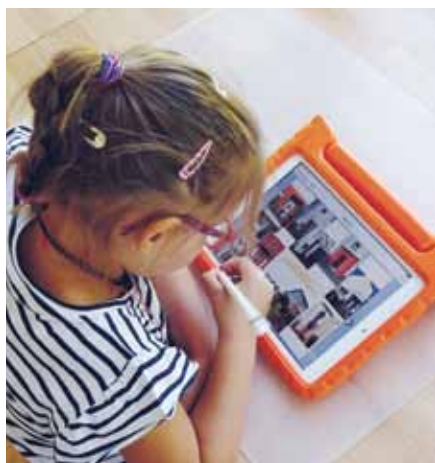
Ein Mädchen aus der Alexianer-Kita arbeitet mit einem Tablet

vereins der Kita Sunnesching Pänz e. V. und der Spendenbereitschaft bei vielen Festen konnte das Kita-Team insgesamt