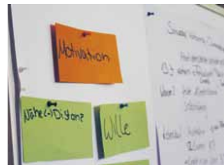
Es wurde viel erarbeitet und dokumentiert