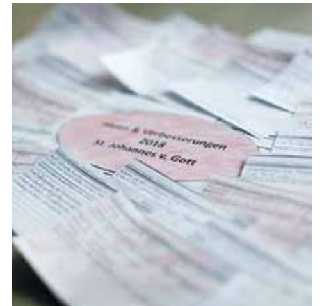
Mehrere hundert Vorschläge äußerten die Kollegen auf den Verbesserungskarten