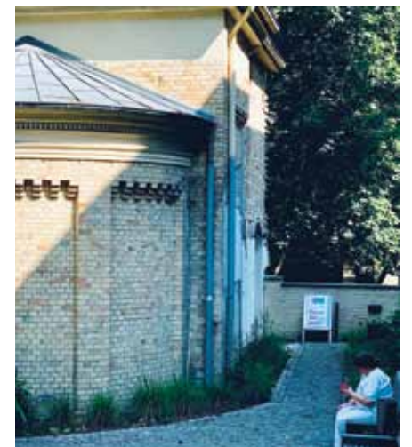
Täglich geöffnet für alle: Der Raum der Stille befindet sich in der kleinen Kapelle im Patientengarten und kann über den Ausgang der Cafeteria erreicht werden

Ruhe finden und mal innehalten – ganz wichtige Faktoren, um gesund zu werden. So steht der Raum der Stille im St. Josefs-Krankenhaus allen Patientinnen und Patienten offen, gleich welcher Religion oder Weltanschauung.