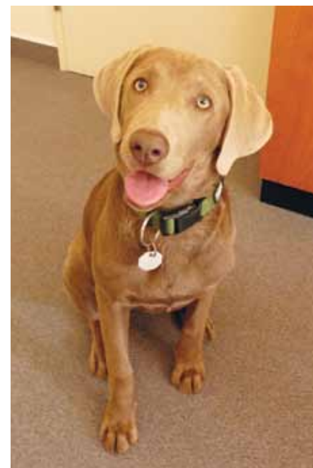
Flicka, ein Hundemädchen im Krankenhaus

Darum gehe ich seit dem diesjährigen Sommer zur Schule, in die Hundeschule, versteht sich. In meiner Freizeit spiele ich am allerliebsten mit meinem bunten Ball. Es gibt schließ-