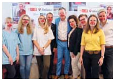
Bei der Auftaktveranstaltung in Münster waren Vertreter aller beteiligten Kooperationspartner anwesend

Kern des Projekts ist die Einbindung des Humors in die Pflegeausbildung als Mittel zur Stressbewältigung. Die Stärkung der psychischen Widerstandskraft ist