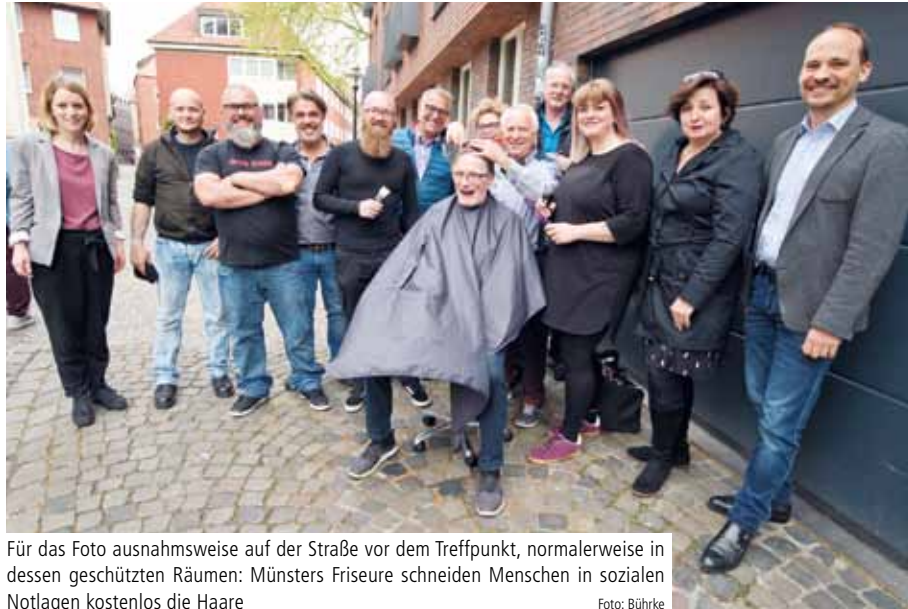
Für das Foto ausnahmsweise auf der Straße vor dem Treffpunkt, normalerweise in dessen geschützten Räumen: Münsters Friseure schneiden Menschen in sozialen Notlagen kostenlos die Haare

Die Aktion ist ein Geben und Nehmen, wie die Friseure bestätigen, die durch die Gespräche mit ihren Kunden viel über die besonderen Herausforderungen eines Lebens am Rande der