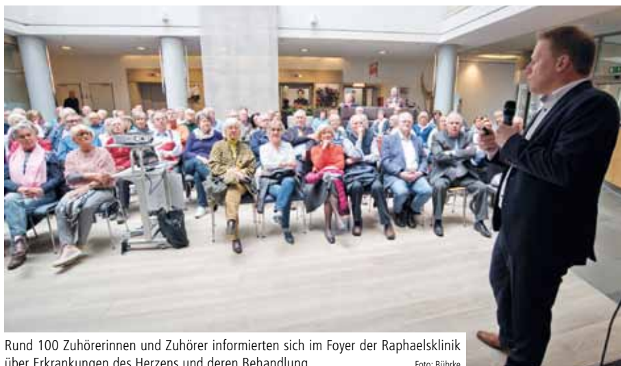
Rund 100 Zuhörerinnen und Zuhörer informierten sich im Foyer der Raphaelsklinik über Erkrankungen des Herzens und deren Behandlung

In seinem Vortrag zum Thema „Herz in Gefahr“ berichtete Lieder über die Funktion, mögliche Erkrankungen und moderne Therapieverfahren rund um das Zentralorgan des Menschen. Dass es bei einem Herzinfarkt um Minuten geht, weiß der Fachmann aus der täglichen Praxis. In der Chest Pain Unit, einer auf Brustschmerzen spezialisierten Abteilung der Notfallambulanz, werden regelmäßig Patienten mit einem Herzinfarkt behandelt. Ist der Notruf einmal getätigt, geht alles