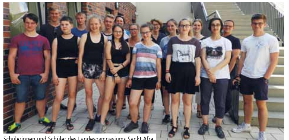
Schülerinnen und Schüler des Landesgymnasiums Sankt Afra zu Besuch im Krankenhaus Hedwigshöhe

Bis zum Ende des lehrreichen Tages beantworteten die Klinikmitarbeiter zahlreiche Fragen. Sie freuten sich über das lebhaftere Interesse und darüber, dass die jungen Menschen