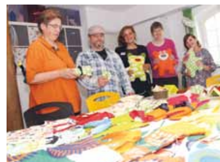
Selbstgefertigtes stellten die Klienten und Mitarbeiter aus dem „zeitraum.“ aus