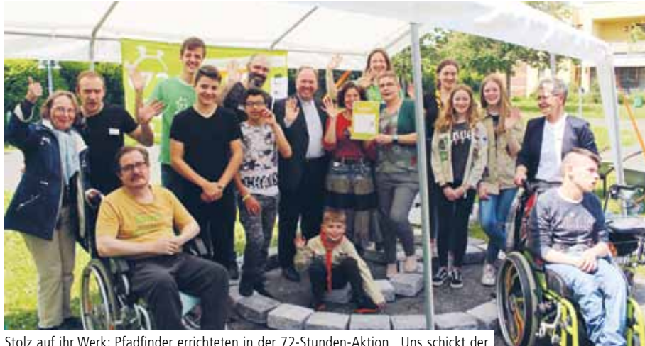
Stolz auf ihr Werk: Pfadfinder errichteten in der 72-Stunden-Aktion „Uns schickt der Himmel“ eine Kräuterschnecke für das Haus Christophorus

Im Juli dieses Jahres erschienen an einem frühen Morgen 20 Pfadfinder des Stammes Johannes Bosco im Alter zwischen sieben und 15 Jahren mit ihren Betreuern, um gut gelaunt mit der Arbeit zu beginnen. Auf Schubkarren der Klostergärtnerei schafften sie die vom BDKJ gespendeten Baumaterialien heran.