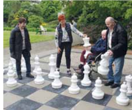
Auch der Issele Aktivtreff testete direkt mal das neue Schachspielfeld

Der Nachmittag beginnt mit einem gemeinsamen Kaffeetrinken. Anschließend ist Zeit für alltägliche Dinge: Spaziergänge, Singen und Basteln, Kochen und Backen, Gesellschaftsspiele, Gedächtnistraining, Wahrnehmungsübungen, die Besprechung des Tagesgeschehens, die Förderung motorischer Fähigkeiten und vieles mehr. Ein strukturierter Ablauf gibt den Teilnehmern Halt und Sicherheit. Im vertrauten Umfeld können wichtige Fähigkeiten genutzt und reaktiviert werden. Auf diese Weise wird nicht nur das Selbstwert-