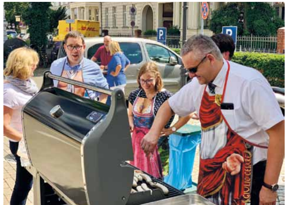
... oder vom Geschäftsführer persönlich – wie hier im Evangelischen Zentrum für Altersmedizin