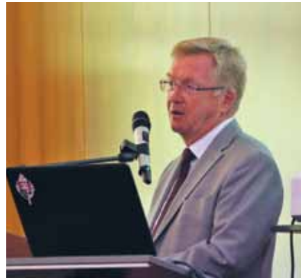
Staatssekretär Andreas Westerfellhaus referierte bei der Alexianer-Tagung Senioren und Pflege

Regionen, weiterhin für ihren Berufsstand einzustehen und, trotz aller Widerigkeiten, den Blick nach vorn zu richten. Der Pflegemarkt sei der Markt der Gegenwart, aber auch der der Zukunft. „Dieser Markt wächst seit 2005 mit fast fünf Prozent pro Jahr und ist mit 47 Milliarden Euro Gesamtumsatz schon heute das drittgrößte Segment im deutschen Gesundheitswesen. Der Bereich wird weiterhin kontinuierlich expandieren und im Jahr 2030 ein