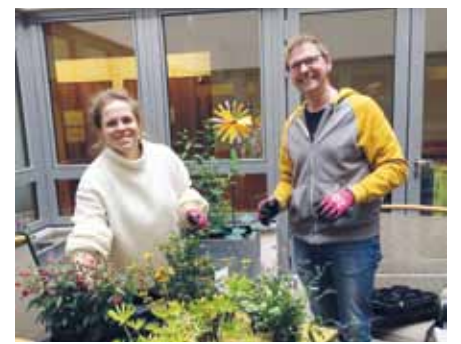
Pflanzaktion auf der Gemeinschaftsterrasse