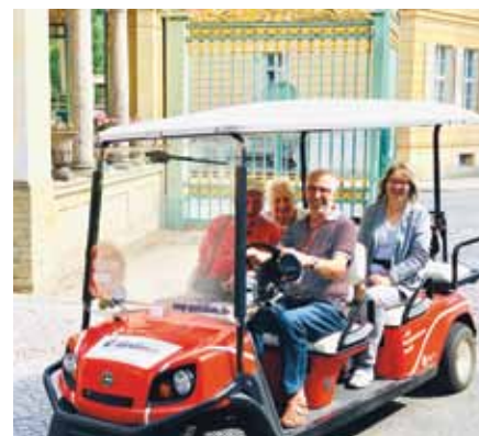
Der ehrenamtlichen Elektro-Shuttle-Service auf dem Weg vom Grünen Gitter zum Neuen Palais

So kam es auch in diesem Jahr wieder zu einem herzlichen Gedankenaustausch der Stiftungen am Rande der