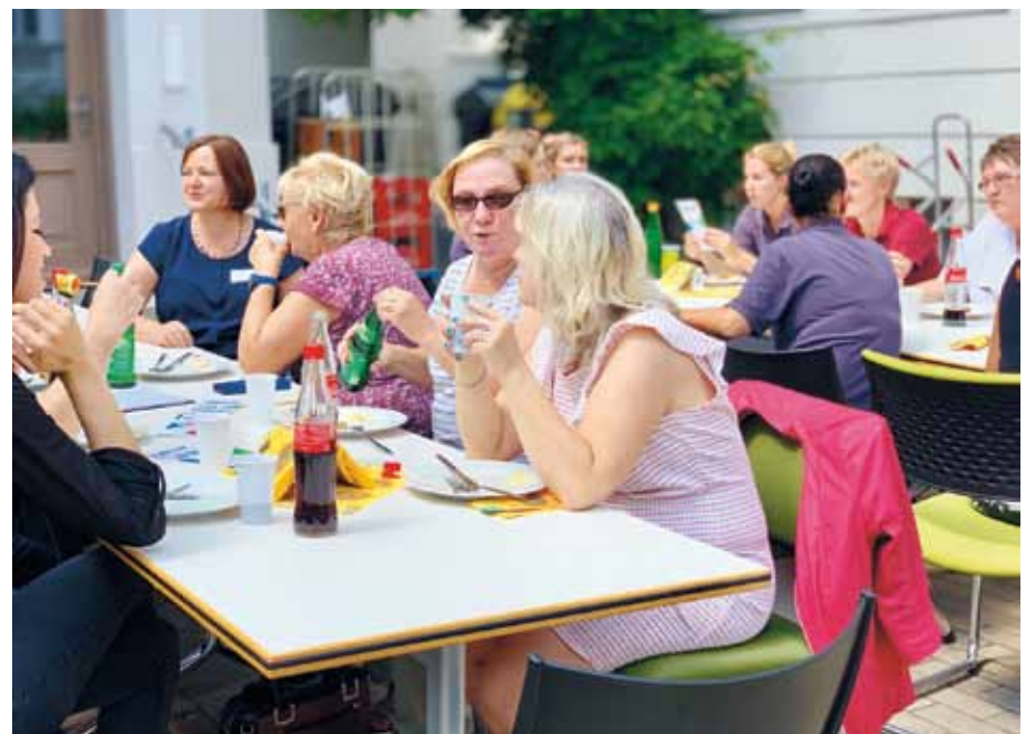
Für die Kolleginnen und Kollegen des Fachkrankenhauses am Weinberg gab es Bratwurst, Steak, Salate und Erfrischungsgetränke