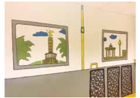
Therapieraum im BVG-Look

Im Mai 2019 hatte die Stationsleiterin deshalb – mit Unterstützung des Vereins „Serve the City Berlin“ – einen Aktionstag auf der Station Balthasar initiiert, an dem Ehrenamtliche ganz praktisch Hand anlegten: Mitarbeitende des Berliner Studienzentrums „Council of International Educational Exchange“ (CIEE) besuchten im Rahmen des „Corporate Volunteering“ (Betriebliches Freiwilligenprogramm) für einen Tag die Station und wurden für die Patienten aktiv. Mit Farbe, Pinsel und großem Enthusiasmus verwandelten sie den ausgewählten Therapieraum in ein Kino mit BVG-Bushaltestelle. Die Blumenkübel auf der Gemeinschaftsterrasse bekamen frische Blumen und Kräuter. Am Ende der Aktion freuten sich nicht nur die Patienten über die altbekannte BVG-Bushaltestelle und die vertrauten Pflanzen auf der Terrasse. Auch die freiwilligen