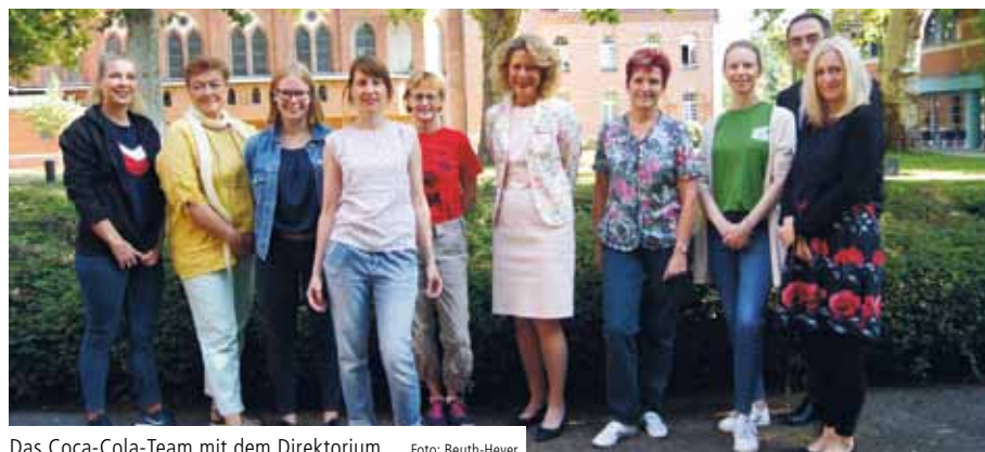
Das Coca-Cola-Team mit dem Direktorium

BERLIN. Im Rahmen des Aktionstages Nachhaltigkeit Coca-Cola 2019 erledigte ein Team der Coca-Cola European Partners Deutschland GmbH die Endlackierung von 16 Bierzeltgarnituren für das Alexianer St. Joseph-Krankenhaus. Die Übernahme unternehmerischer Gesamtverantwortung durch Aktivitäten wie diese hat bei dem Getränkehersteller eine lange Tradition.