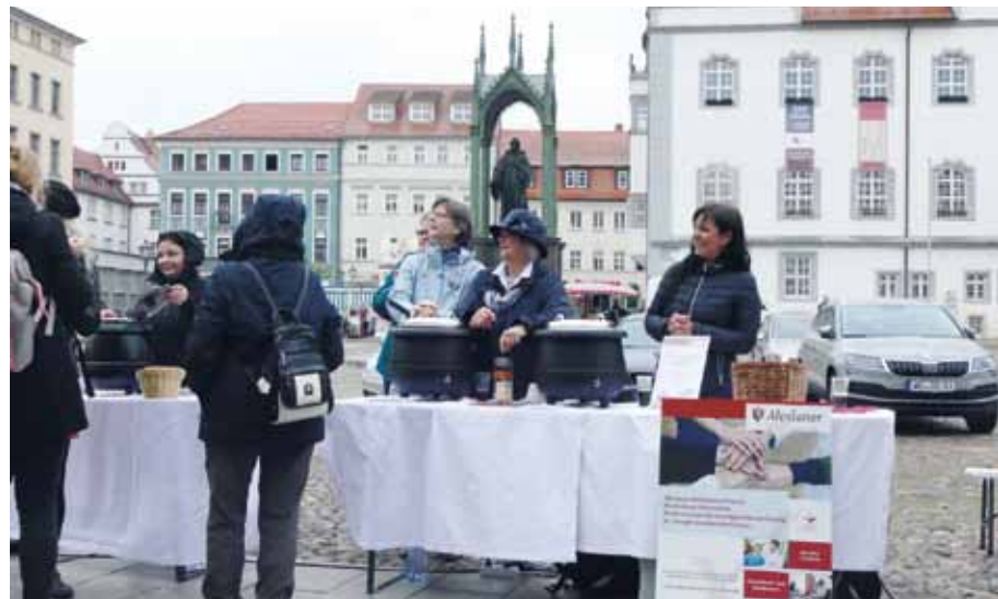
Bereits um 12.30 Uhr waren 18 Liter Suppe der Alexianer verkauft und die Töpfe leer