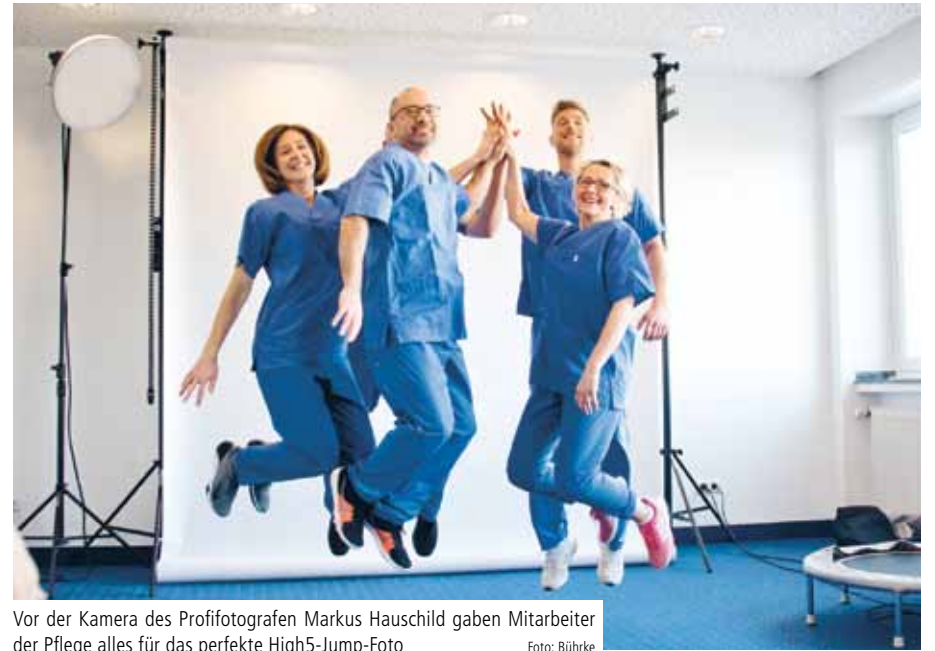
Vor der Kamera des Profifotografen Markus Hauschild gaben Mitarbeiter der Pflege alles für das perfekte High5-Jump-Foto

Clemenshospital und Raphaelsklinik gehen innovative Wege bei der Personalgewinnung