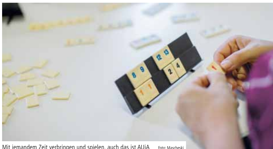
Mit jemandem Zeit verbringen und spielen, auch das ist AUiA

Wie die Alexianer Ambulanten Dienste mit „AUiA“ Pflegebedürftigen das Leben erleichtern