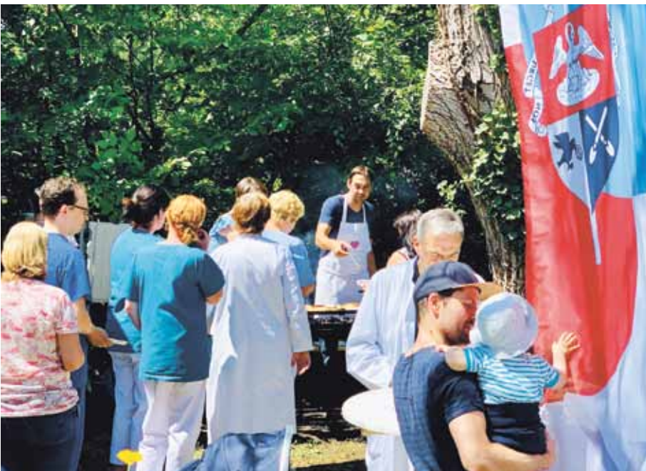
Das sommerliche Angrillen für die Mitarbeitenden ist eine feste Tradition in den Potsdamer Alexianer-Einrichtungen. Hier leidenschaftlich grilliert vom Team der Krankenhausverwaltung im Nonnengarten am St. Josefs ...

chen Extremsituationen aufrechterhalten werden. Die Regionalgeschäftsführung bedankt sich ganz herzlich für das besondere Engagement aller Kolleginnen und Kollegen, die auch im Hochsommer mit Leidenschaft und Eifer ihren Dienst in den Potsdamer Alexianer-Einrichtungen ausübten. ✕ (bs)