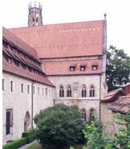
Im Augustinerkloster in der thüringischen Landeshauptstadt konnten die Mitarbeiterinnen entschleunigen