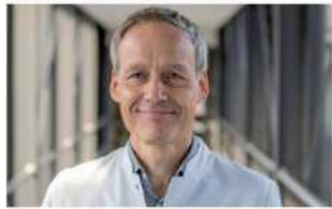
Պրոֆ. Դոկտոր Շտեֆեն Վայկերտ